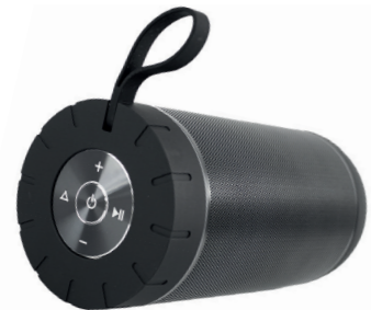
BLUETOOTH SPEAKER OWI B11

Recomenda-se ler atentamente este manual do usuário e guardá-lo para referência futura.